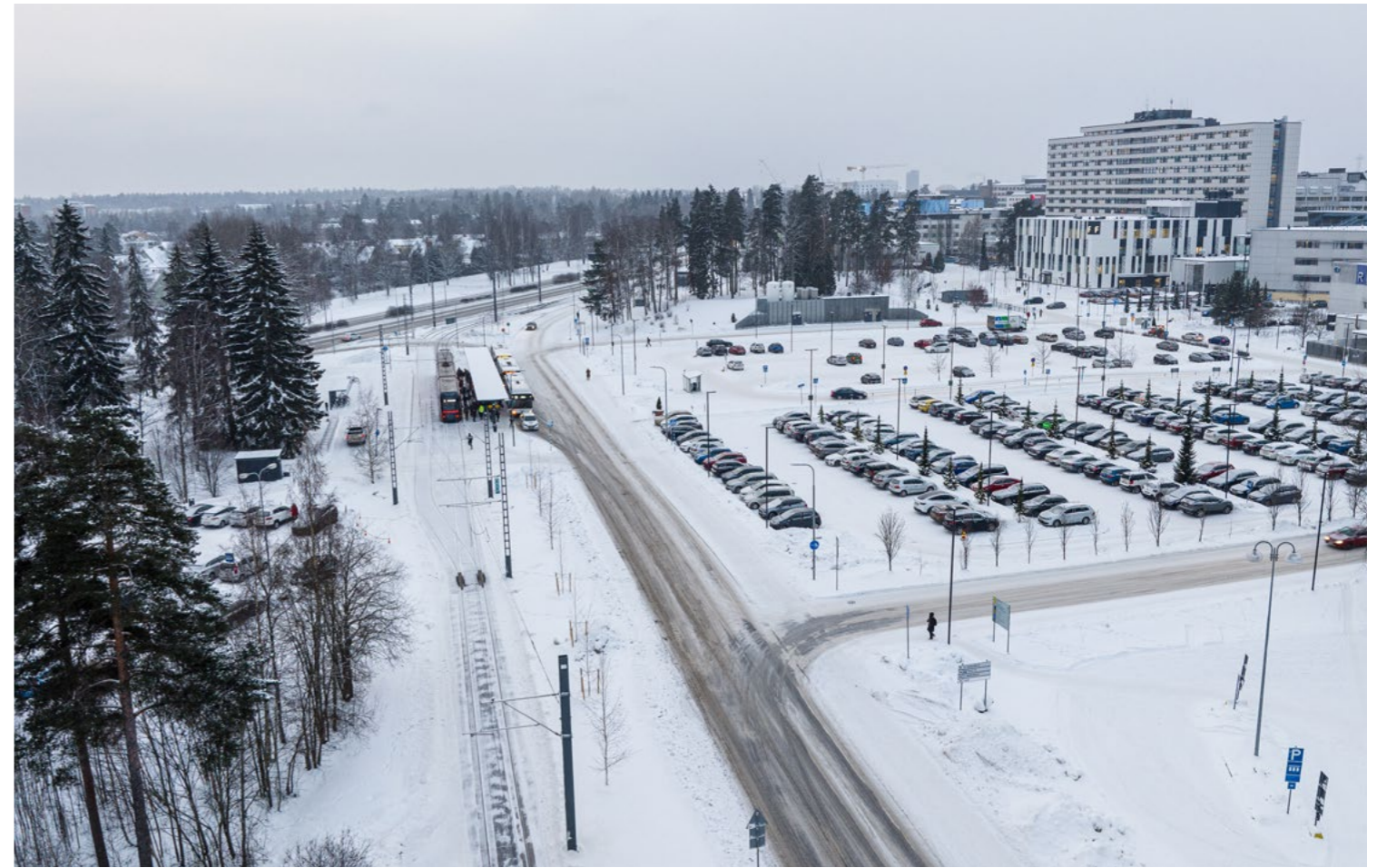
Kaupin kampuksen raitiotiepysäkki joulukuussa 2023.