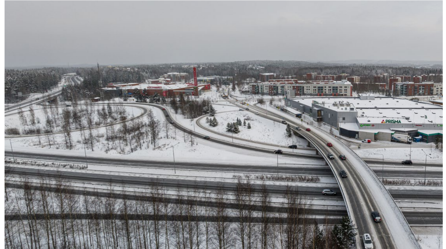
Raitiotietä suunnitellaan valtatie 9 yli Linnainmaan suuntaan. Kuva on otettu joulukuussa 2023.