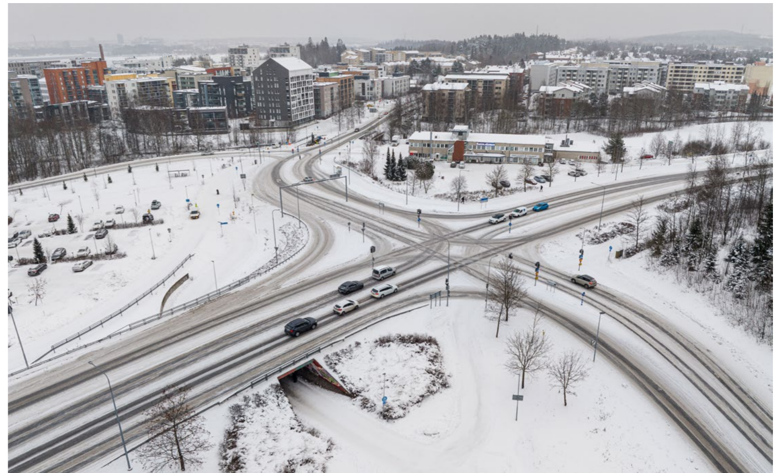
Raitiotien suunnittelualue Partolasta Naistenmatkantien, Kenkätien ja Nuolialantien risteyksestä. Kuva on otettu joulukuussa 2023.

Katusuunnitelmaehdotusten nähtävillä olosta tiedotetaan kuulutuksilla Pirkkalainen-lehdessä, Pirkkalan kunnan verkkosivuilla ja virallisella ilmoitustaululla (Asiointipiste, Viistokuja 3, 33960 Pirkkala).