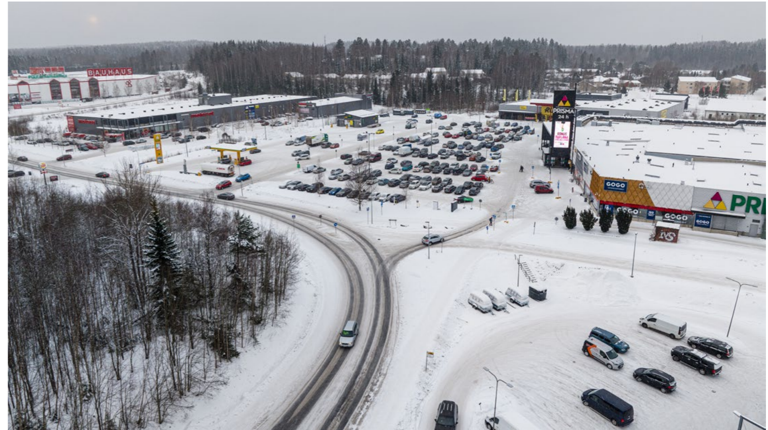
Raitiotien suunnittelualue Partolassa. Kuva on otettu joulukuussa 2023.