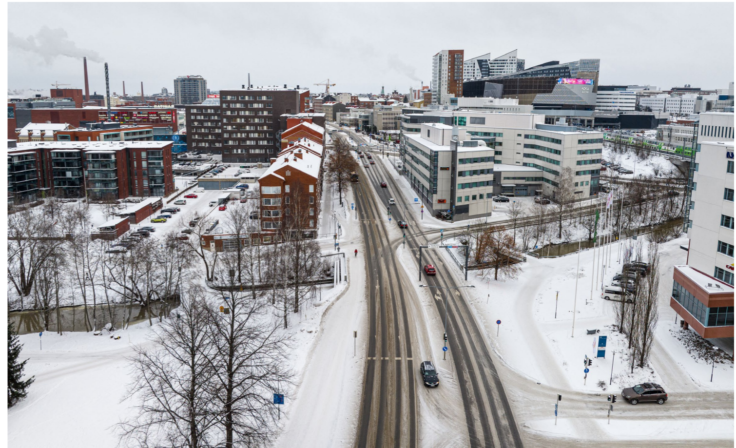
Raitiotien suunnittelualue Hatanpään valtatiellä Viinikanlahden sillan kohdalta. Kuva on otettu joulukuussa 2023.