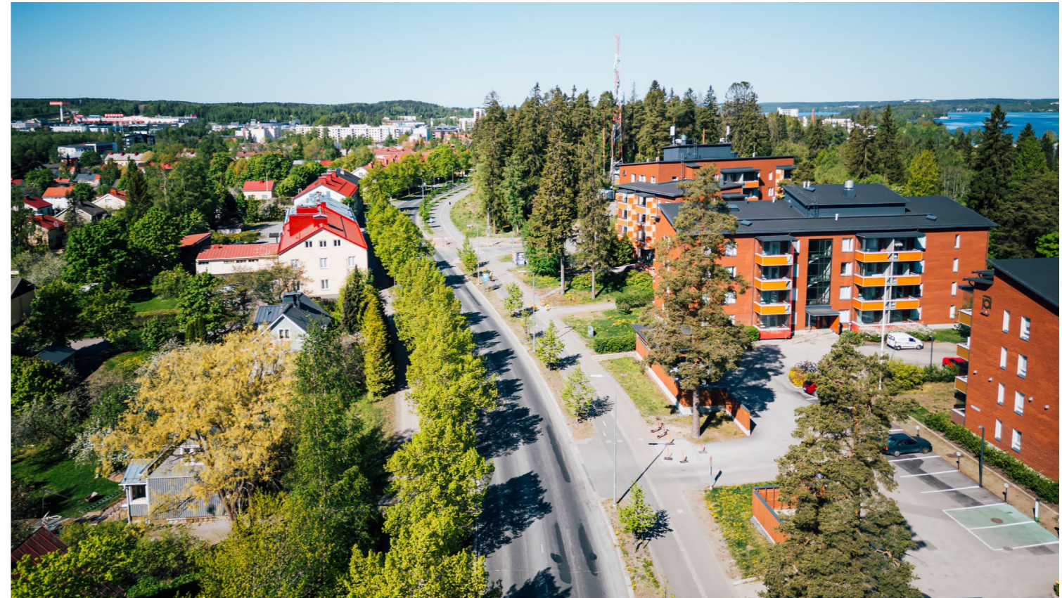
Raitiotien suunnittelualue Nuolialantieltä Härmälästä Pirkkalan suuntaan. Kuva on otettu toukokuussa 2024.