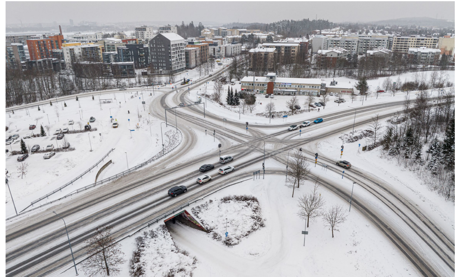
Raitiotien suunnittelualuetta Partolasta Naistenmatkantien, Kenkätien ja Nuolialantien risteyksestä. Kuva on otettu joulukuussa 2023.

Katusuunnitelmaehdotusten nähtävillä olosta tiedotetaan kuulutuksilla Pirkkalainen-lehdessä, Pirkkalan kunnan verkkosivuilla ja virallisella ilmoitustaululla (Asiointipiste, Viistokuja 3, 33960 Pirkkala).