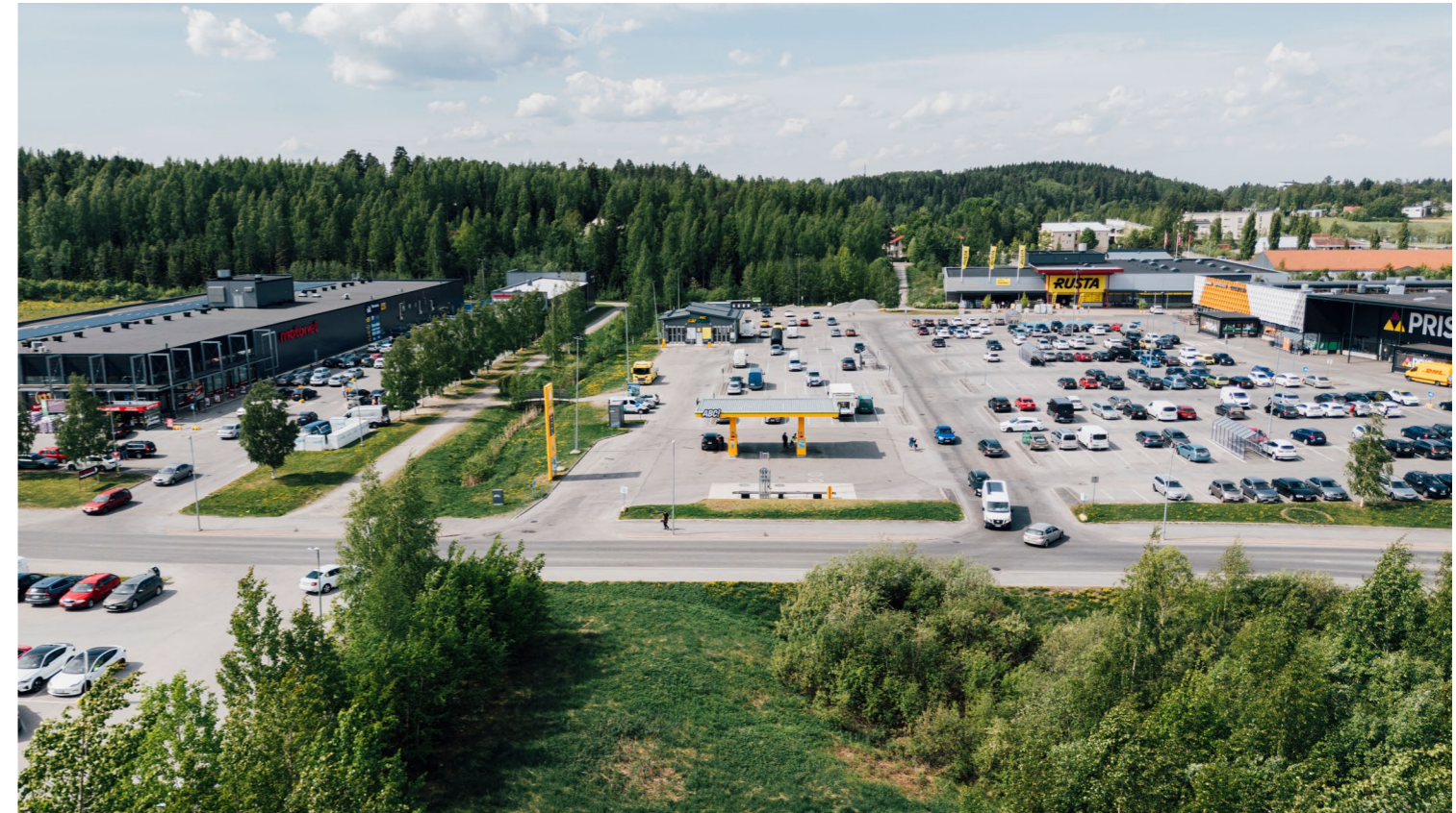
Raitiotien suunnittelualuetta Partolassa. Kuva on otettu toukokuussa 2024.